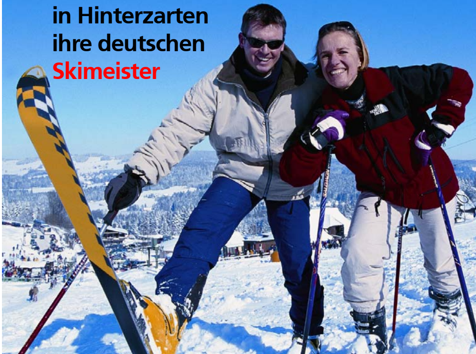
Hinterzarten bietet beste Bedingungen für Wintersport.