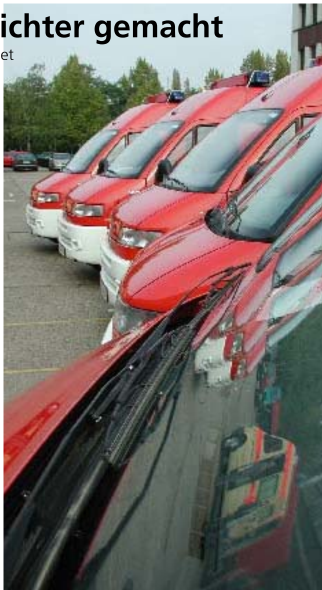
Ob Groß- oder Einzelbeschaffung: Mit Hilfe der DFV-Vorlagen wird die Ausschreibung leicht überschaubar.